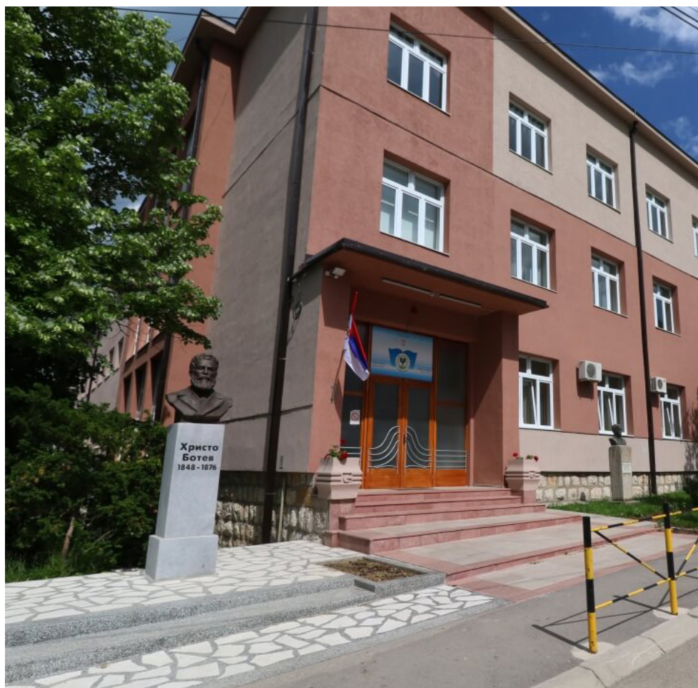
ОУ „Христо Ботев“ в Цариброд